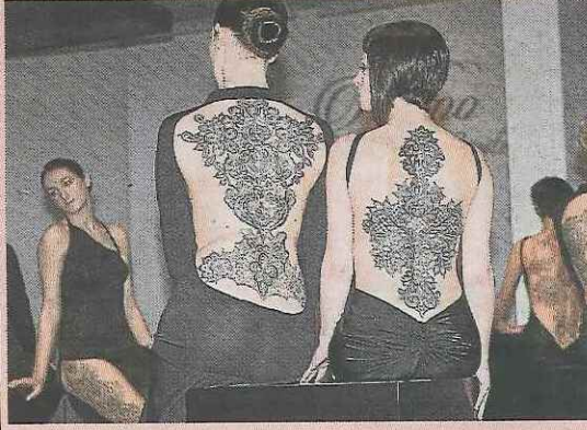
MODA A FLOR DE PIEL. Varias modelos lucen las creaciones de tatuajes del diseñador italiano Marco Manzo.

Y muchas más, en las fotogalerías de 20minutos.es