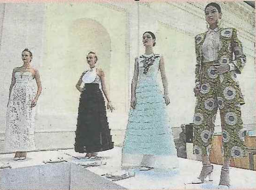
UNA PRIMAVERA/VERANO ATREVIDA. La capital italiana acoge hasta hoy su semana de la moda, en la que ayer desfiló la firma Gattinoni (imagen).