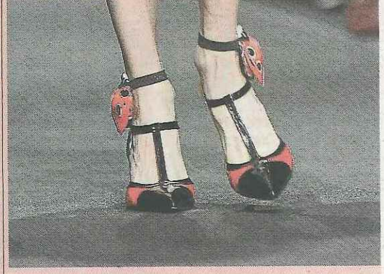
PISANDO CON GRACIA. La firma Piccione apostó por la originalidad a la hora de diseñar su calzado para la temporada primaveral.

Y muchas más, en las fotogalerías de 20minutos.es