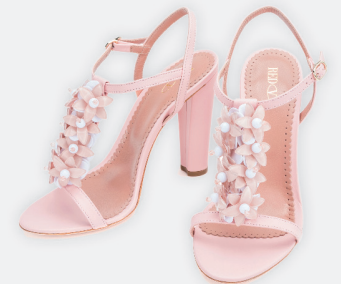
Sandalias flores Red Valentino