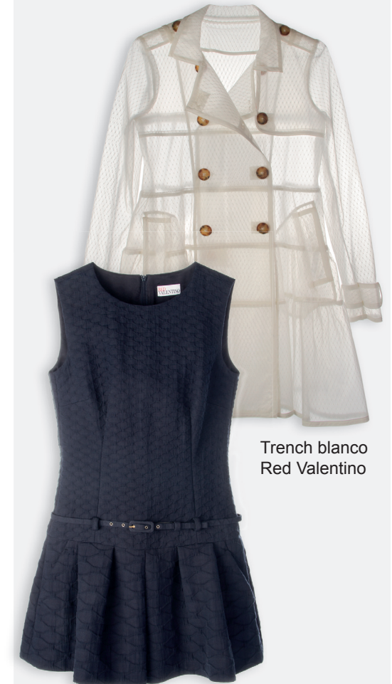
Trench blanco Red Valentino